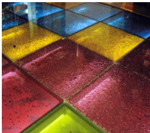
Figura 3. Vidrio craquelado de color.

Puede utilizarse vidrio de color o PVB de color (o combinación de ambos incluso) para un mejor efecto visual.