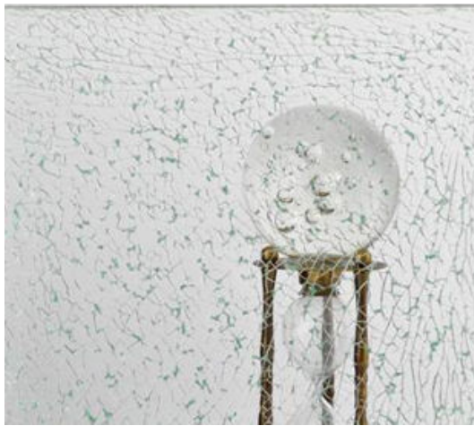
Figura 1. Efecto visual de un vidrio craquelado.

El vidrio craquelado es un vidrio laminado compuesto de una lámina interna de vidrio templado y dos láminas externas de vidrios templados. Cuando se quiebra el vidrio templado interno, sus fragmentos se juntan a las películas plásticas (PVB) y permanecen fijos a las láminas externas. Los fragmentos en contacto con la luz provocan un efecto visual diferente y muy decorativo.